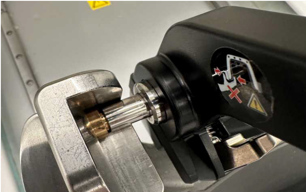
Figura 3. Adaptor cuplat și aliniat corect.