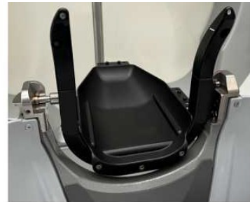
Adaptor pentru mască